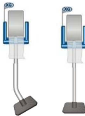
Con la Base inclinada